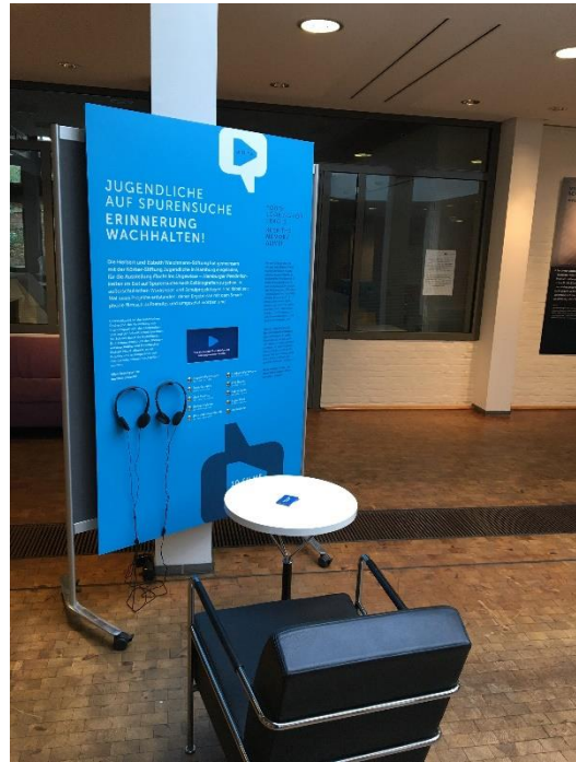
Ausstellungsansicht im Haus im Park

Nach der Auftaktstation im Hamburger Rathaus im November letzten Jahres wanderte die Ausstellung »Flucht ins Ungewisse – Hamburger Persönlichkeiten im Exil« Anfang Februar bis Mitte März ins Haus im Park der Körber-Stiftung in Hamburg-Bergedorf. Die Ausstellung zeichnet die Lebenswege Exilierter nach, die zwischen 1933 und 1939 aus der Hansestadt geflohen waren. Weitere Informationen finden Sie hier .