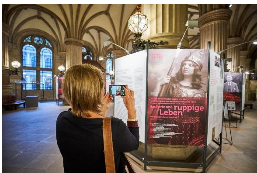
Ausstellung im Hamburger Rathaus