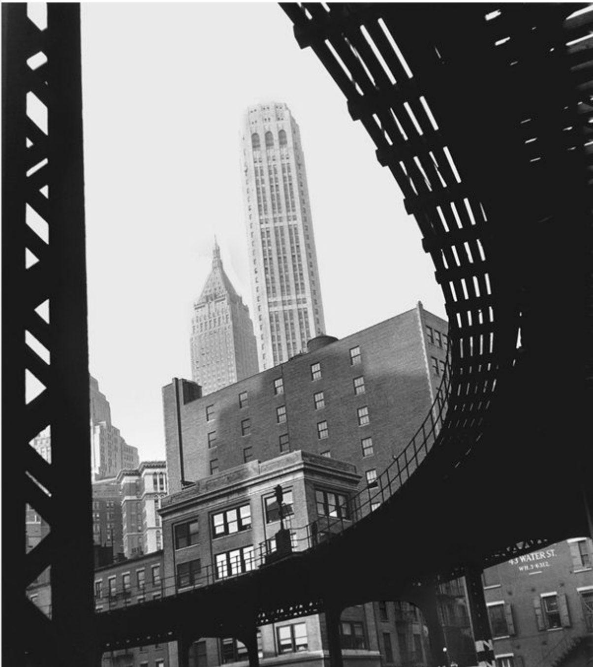
Fred Stein, Coenties Slip, New York, 1946