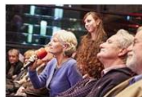
Fragen aus dem Publikum